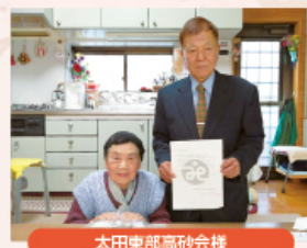
太田東部高砂会様