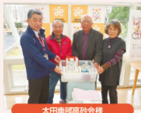
太田南部高砂会様