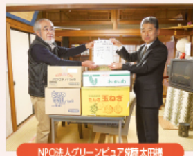
NPO法人グリーンピュア常陸太田様