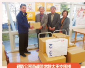
逓信公務員連盟常陸太田支部様