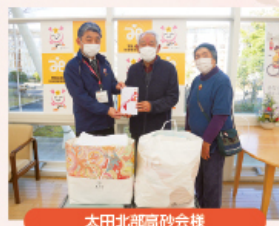
太田北部高砂会様