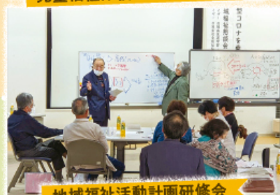
地域福祉活動計画研修会