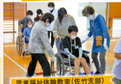
児童福祉体験教室(佐竹支部)