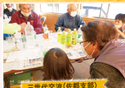
三世代交流(佐都支部)