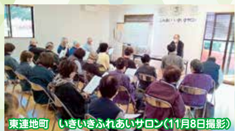
東連地町 いきいきふれあいサロン(11月8日撮影)