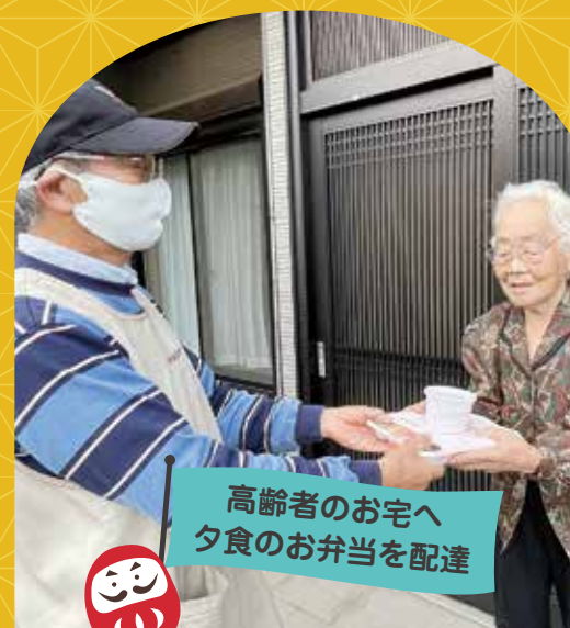
高齢者のお宅へ 夕食のお弁当を配達