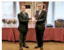
常陸太田ライオンズクラブ様