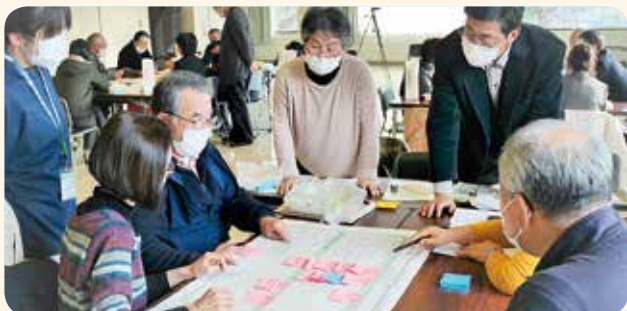
小里支部・賀美支部

社協支部は、地域の皆さまが協力して人と人とのつながりをつくる福祉活動に取り組んでいます。支部ごとに話し合いの場「地域ふくし懇談会」を開催し、新型コロナウイルスの影響などを踏まえ、これからの取り組みやスローガンなどを話し合い、たくさんのアイデアが出されました。今後は、それぞれの地域の取り組みを「活動計画」としてまとめ、福祉のまちづくりを進めます。