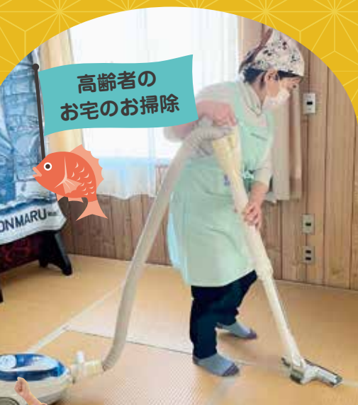
高齢者の お宅のお掃除