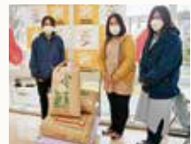
お米を市内の保育園へ