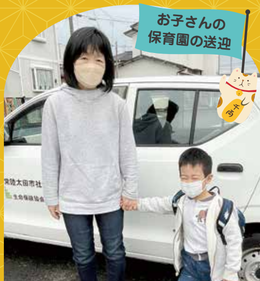
お子さんの 保育園の送迎