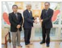
常陸太田ロータリークラブ様

(児童養護)誉田養徳園 米・食料 NPO法人たんたん 食料 (特養)西山苑 食料 太田あすなる保育園 米・もち米 らいらく保育園 米・もち米 太田さくら認定こども園 米・もち米 はすみ保育園 もち米 ぽこ・あ・ぽこ 米 ひよこ園 米 (特養)松栄荘 米 グループホーム ワコー大里 米 (福)朋友会ひまわり 米 障害者支援施設 ピュア里川 米 ディサービスセンター 花・大里 米