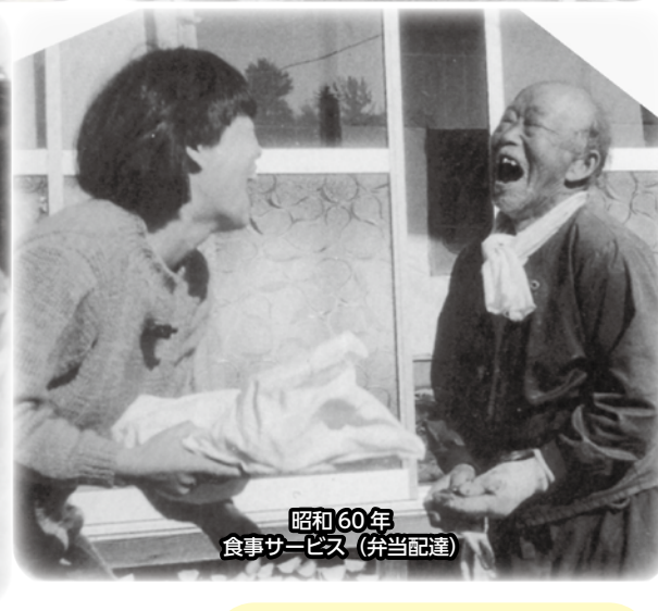
昭和60年 食事サービス(弁当配達)