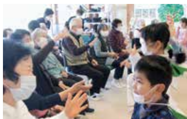
▲生き生きふれあい事業