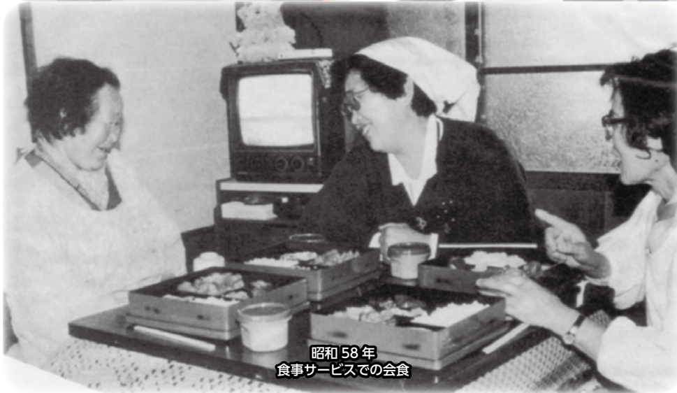
昭和58年 食事サービスでの会食