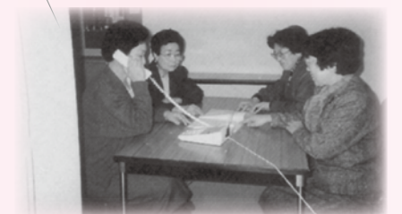
テレホンサービスで安否確認する「民協婦人部」

ボランティアの努力で支部が発足し、支部事業として食事サービス、料理教室、友愛訪問など地域に根ざした福祉活動が実施