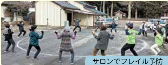
サロンでフレイル予防

初年度は、特に5町会毎のサロン会で軽運動&お喋りなどを行って心身をリフレッシュし、環境美化であたたかな「つながり」を、多世代での歴史文化にふれるウォークで愛郷心のある「つながり」を、旬のものにふれ感動を共有した「つながり」を深化する事業に取り組みます。