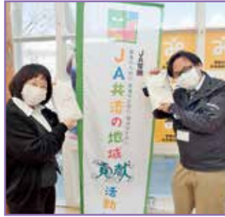
常陸農業協同組合 様