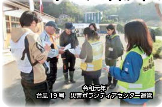
令和元年 台風19号 災害ボランティアセンター運営