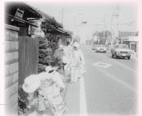
道路清掃する世矢ボランティアグループ