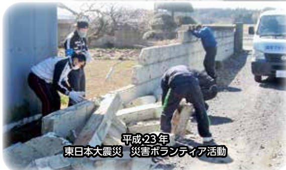
平成23年 東日本大震災 災害ボランティア活動