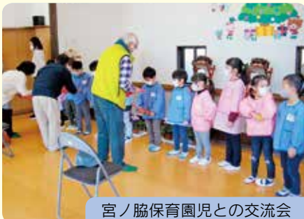
宮ノ協保育園児との交流会

また、2月1日に地域ふくし懇談会を実施し、町会長・民生委員・老人会長・公民館長・支部役員26名で、活動の見直し・今後の活動の指針について話し合いました。今年度も各交流事業を継続し、地域の絆が深まるよう活動してまいります。