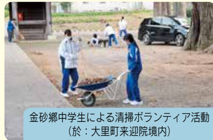
金砂郷中学生による清掃ボランティア活動 (於：大里町来迎院境内)