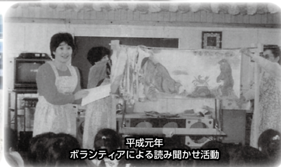
平成元年 ボランティアによる読み聞かせ活動

社会福祉法人 常陸太田市・金砂郷町・水府村・里美村社会福祉協議会 合併協定調印式