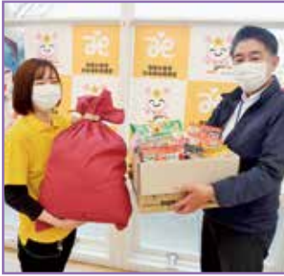
㈱アンダーツリー東京キコーナ太田店 様