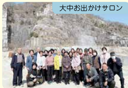
大中お出かけサロン