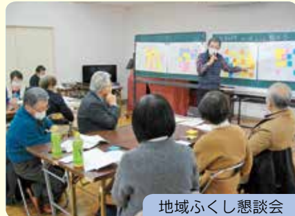
地域ふくし懇談会