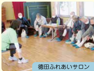
徳田ふれあいサロン

また、町会ごとに実施しているサロンなどは、より集まりやすい方法を考えたり、体操や保健指導などと組み合わせていきたいと思っています。楽しみなお出かけサロンも、気軽に実施できるようになるといいなと願っています。