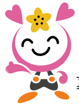
マスコットキャラクター「タッチィー」