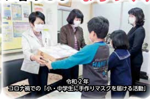
令和2年 コロナ禍での「小・中学生に手作りマスクを届ける活動」