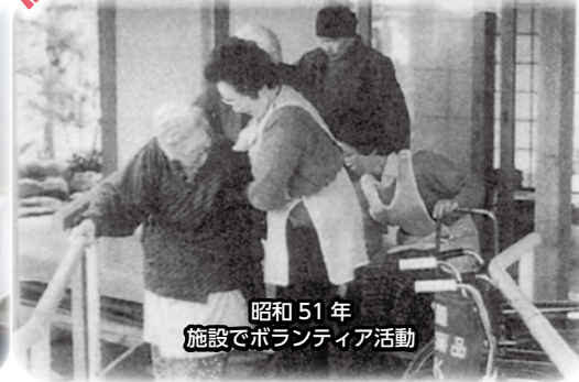
昭和51年 施設でボランティア活動