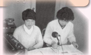
市の広報をテープに吹き込む「ゆずりは会」会員

婦人ボランティアグループにより、ひとり暮らし高齢者の食事サービスを実施。この食事サービスを更に小地域で実施しようと支部結成に向けて動き出します!