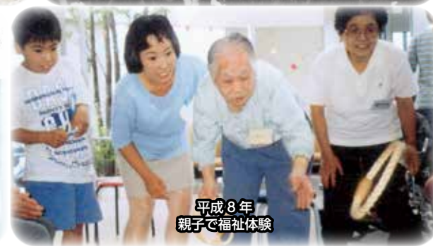
平成8年 親子で福祉体験