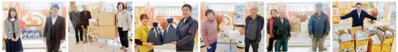
第一生命労働組合水戸支部 様 茨城県退職公務員連盟常陸太田支部 様 (株)アンダーワン東京キョウナ太田店 様 太田北部高砂会 様 太田南部高砂会 様 (株)かわねや 様