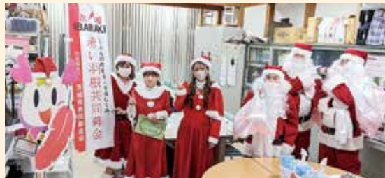
学生や社会人の“サンタボランティア”が大活躍

訪問先では、突然のサンタクロース訪問に、泣き出す子・啜然とする子・さまざまな反応がありましたが、最後にはみんなとびっきりの笑顔を見せてくれました。