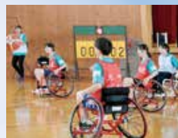
福祉チャレンジスクール