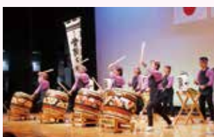
天神林町天神ばやし保存会 「天神ばやし太鼓」