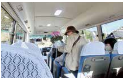
⑥買い物ツアーを楽しんで帰宅