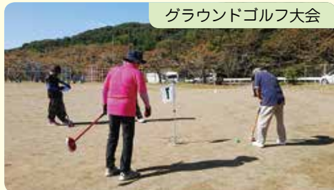
グランドゴルフ大会

金砂地区の高齢化、過疎化は深刻なため少ない住民同士の関係が深まるような楽しくふれ合う交流の場を大事に、今後も公民館や地区の代表の方々と協力して活動してまいります。