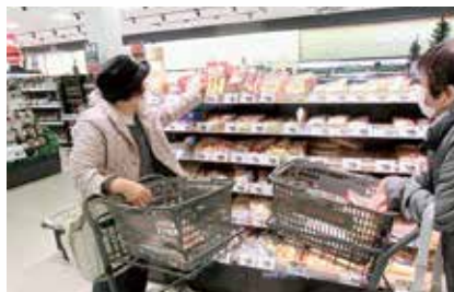
⑤スーパーマーケットでお買い物