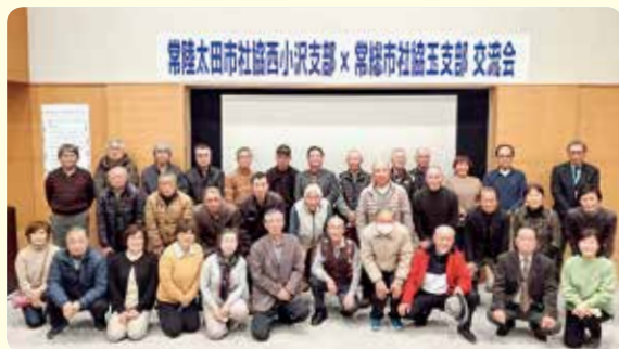
常総太田市社協西小沢支部 × 常総市社協玉支部 交流会

12月1日に支部研修で町会長、老人会長、民生・児童委員など29名が常総市総合福祉センターを訪れ、同市社会福祉協議会玉支部との交流会を行いました。同市は平成27年9月の豪雨で鬼怒川の堤防が決壊し水害を被っており、市職員の方・当時の玉支部長や民生・児童委員から、氾濫時の映像やその後の罹災者に対する支援状況などの説明を受けました。当西小沢地区は昭和13年9月に久慈川と里川が氾濫して床上浸水などの被害を受けたのが最後です。西小沢地区は高齢者が多いこともあり、参加された皆さんから、災害時の安全確保やその後の支援状況など活発な意見交換がされました。