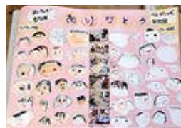
らいらっく保育園 様