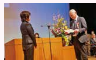
受賞者代表による謝辞