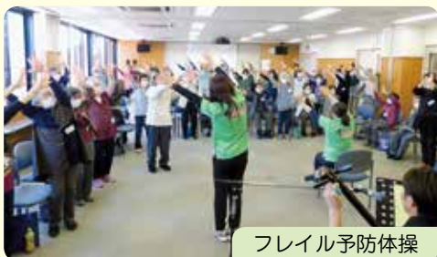
フレイル予防体操

コロナ感染症の5類移行に伴い、ふれあいサロン会を4年振りに再開しました。密を避けるために地域を2つに分けて感染対策を行いながら126名が参加し実施しました。フレイル予防のお話・体操、三味線鑑賞など楽しいひと時を過ごしました。参加者は「フレイルにならないための食事の工夫が必要だと思った。」「生の三味線は迫力があって元気が出た。」「なんともいっても「久しぶりに地域の友達と会えたことが嬉しかった。」と喜んでいました。