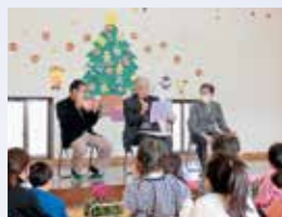
保育園との交流(菅田支部)