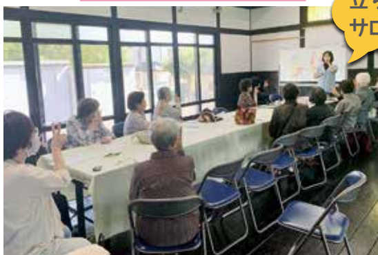
手話を使って参加者で歌を歌いました。