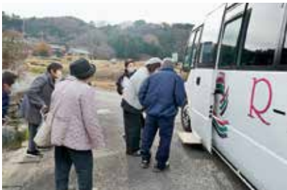
①バスに乗って出発

ひとり暮らし高齢者などで運転ができない方や免許返納などで外出や買い物が難しい方を対象に佐都支部茅根町会で、町会長をはじめ地域の方々の協力をいただき行いました。