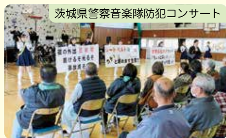
茨城県警察音楽隊防犯コンサート

金砂公民館と共催で、12月2日、待望の茨城県警察音楽隊防犯コンサートを開催することができました。参加者130名、大盛況に終わりました。また、10月には、誰でも参加できるグランドゴルフ大会を開催しました。