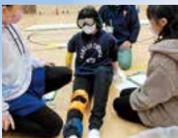
福祉体験学習(水府小学校)