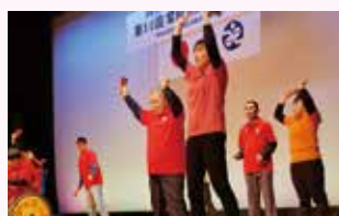
生活介護事業所「ゆめの樹」 「演舞」