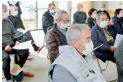
②10時から佐都公民館で健康教室