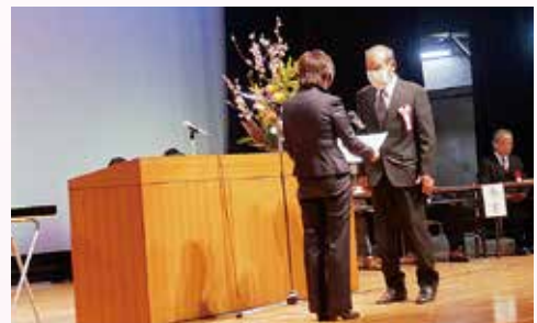
社協会長特別表彰