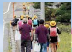
見守りボランティア活動(久米支部)