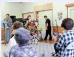
ふれあいサロン会(小里支部)