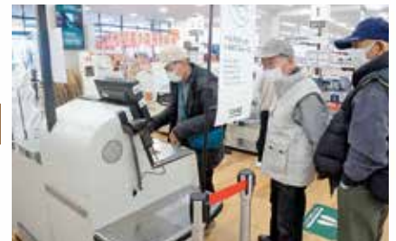
④ホームセンターでお買い物