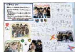
太田あすなろ保育園 様