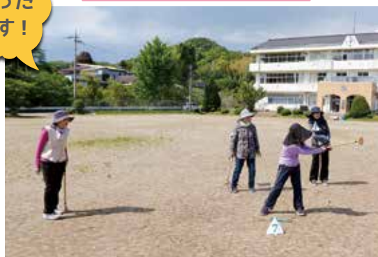
元気にグラウンド・ゴルフを楽しんでいます。