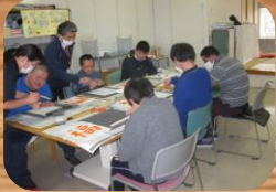
* 書道教室 *