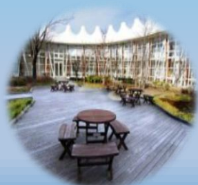
総合福祉会館内（廊下・中庭）