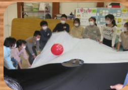
* 小学生との交流会 *