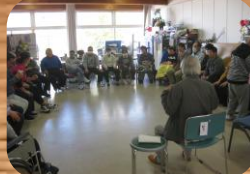
* 医療相談 *