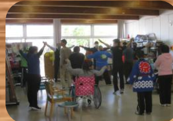
* 夏祭り *