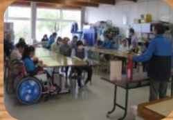
* 防災教室 *