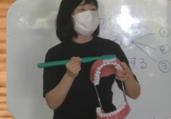
* 口腔教室 *