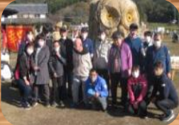
* かかし祭り見学 *